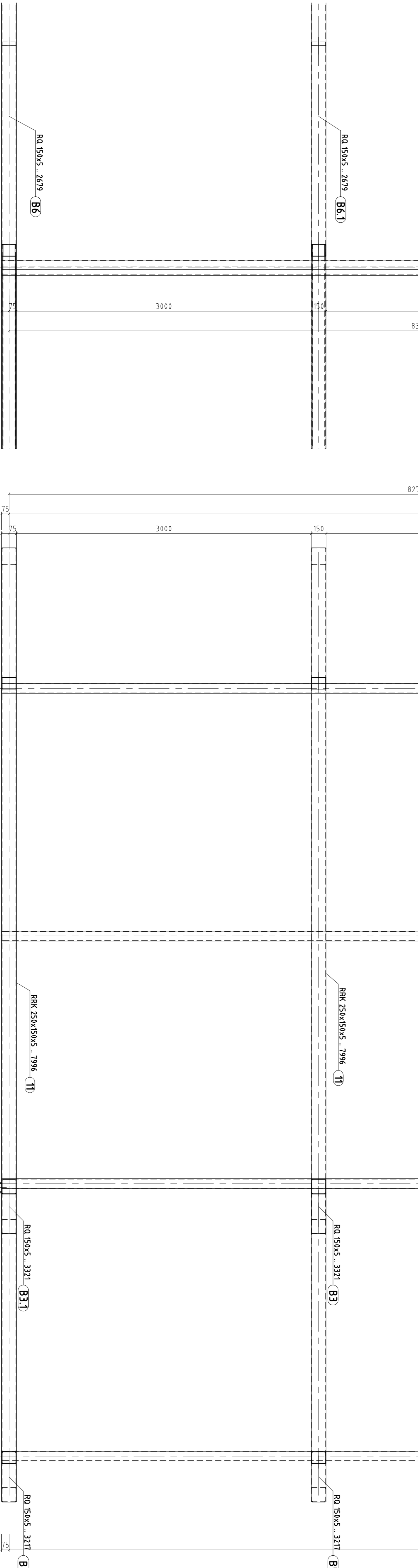
Povzorni pogled na plosni del strehe (M125)